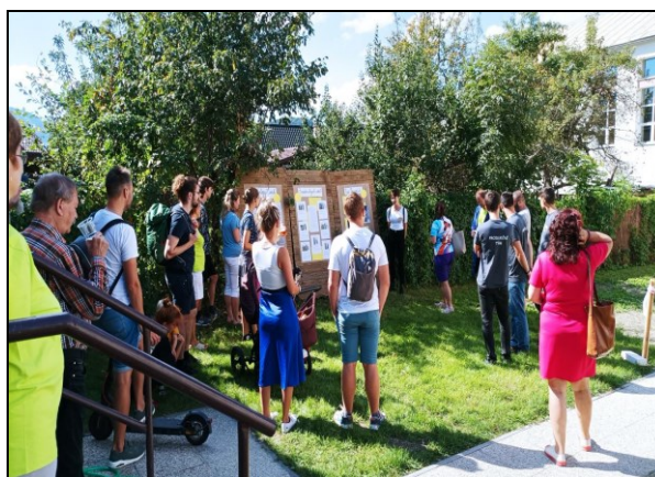
akce Zažít město jinak