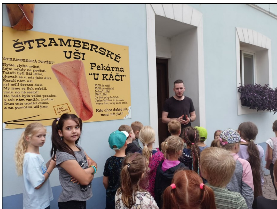
projektový den ŠD ve Štramberku

2) Nově se škola zapojila do čtyřletého vzdělávacího projektu TPA – Inovační centrum pro transformaci vzdělávání, který byl podpořen z Operačního programu Spravedlivá transformace, žadatelem je Moravskoslezský kraj a jedním z partnerů vzdělávací centrum KVIC.