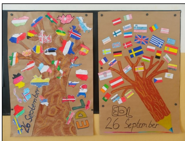
projekt Evropský den jazyků

Volitelný předmět Cvičení z anglického jazyka (místo německého či ruského jazyka) si mohou zvolit žáci, kteří mají v době volby platné vyšetření z PPP s diagnostikou speciálních vzdělávacích potřeb (§16 školského zákona). Této možnosti letos využilo 27 žáků.