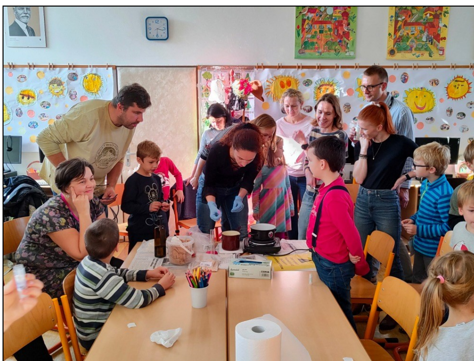
společný workshop rodičů a dětí k výrobě přírodní kosmetiky

K prezentaci školy přispěly rozsáhlejší akce, které se škole podařilo v průběhu školního roku zorganizovat. Z těchto akcí je třeba jmenovat okresní finále přespolního běhu na Horečkách, zapojení do městské akce Zažít město jinak, den otevřených dveří, adventní jarmark, pasování prvňáčků na čtenáře, schůzky Šikovného předškoláčka, vystoupení žáků na Dni města, slavnostní předání vysvědčení žákům 9. ročníku v kině, dvě sběrové akce a další.