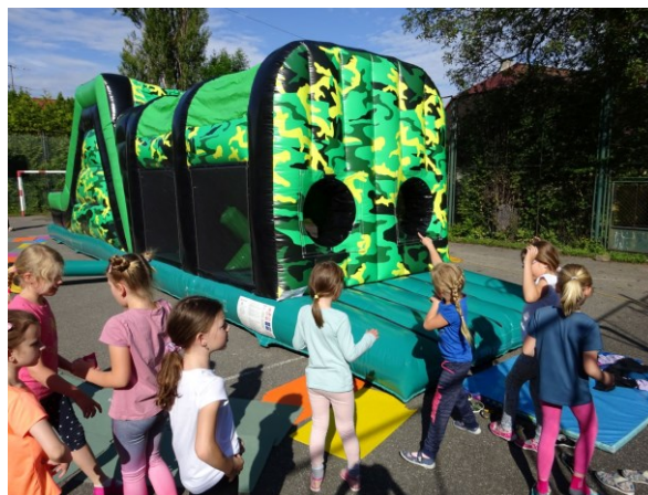
oslava Dne dětí