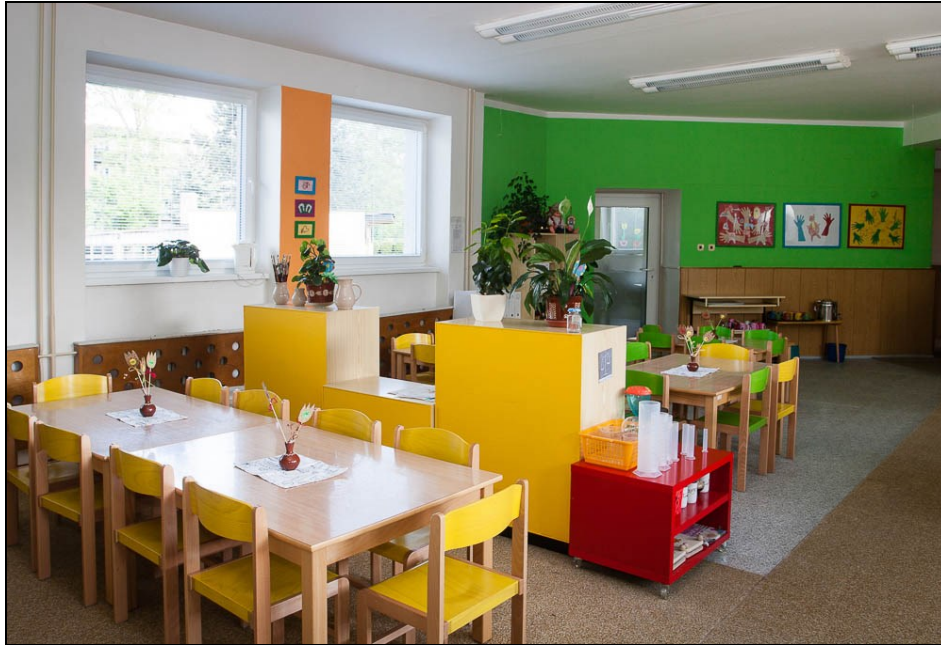
třída mateřské školy Markova

Přílohou této výroční zprávy je výroční zpráva mateřské školy jako součásti právního subjektu.