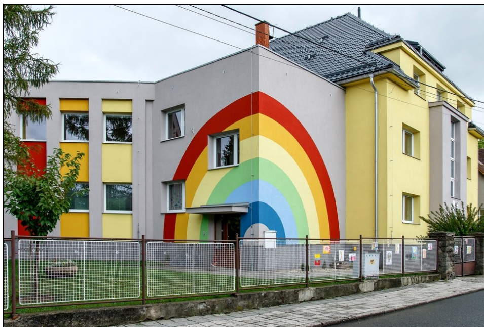
mateřská škola Markova

Můžeme konstatovat, že se nám daří společnými silami postupně zlepšovat vybavení mateřské školy i kvalitu předškolního vzdělávání (společné projekty Šablony, digitalizace školní matriky Digiškolka, sdílený školní psycholog a školní speciální pedagog, projekt Šikovný předškoláček, zápis do 1. tříd), dochází k pozitivnímu vzájemnému propojení při vzdělávání, k omezení provozních problémů zařízení a k plynulejšímu přechodu dětí z MŠ do ZŠ.