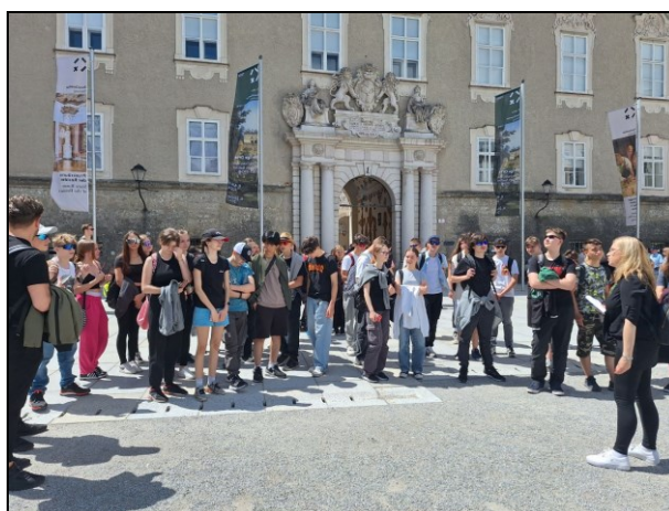
zájezd do Salcburku