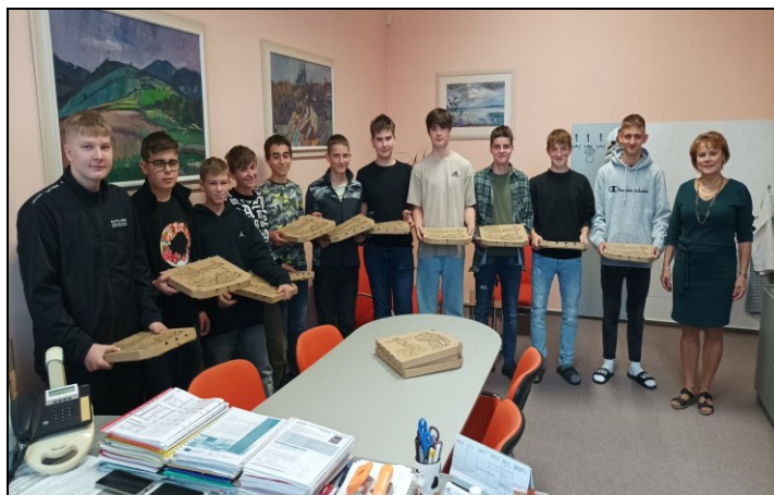
odměna pomocníkům sběru