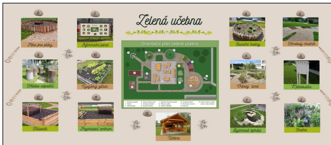
informační tabule zelené učebny

Součástí areálu školy je školní dvůr, malé školní hřiště s asfaltovým povrchem, víceúčelové hřiště při ZŠ Tyršova 1053 a školní zahrada se zahradním domkem. Od podzimu 2021 mohou žáci využívat ke vzdělávací činnosti nově zbudovanou přírodní učebnu s ekologickými koutky, která vznikla v místě dříve nevyužitého školního sadu a byla částečně financována z dotace Státního fondu životního prostředí. Přírodní zahrada slouží ke vzdělávací činnosti žáků nejen přírodovědných předmětů, ale v odpoledních hodinách také pro činnost kroužků a školní družiny.