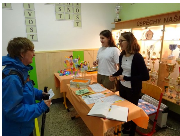
Den otevřených dveří