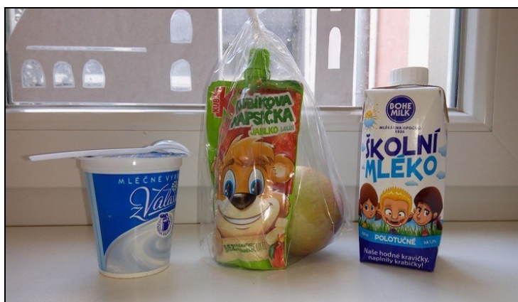
projekt Ovoce a mléko do škol (ukázka svačiny)

4) Škola je dlouhodobě zapojena také do Školního projektu Evropské unie „ Ovoce a zelenina do škol “ a „ Mléko do škol “, díky němuž dostávají všichni žáci 1. až 5. ročníku ve škole 1x měsíčně bezplatně ovocnou a mléčnou svačinu z nabídky Ovocentra V+V s. r. o. z Valašského Meziříčí. Tato moravská firma nám dále nabízí doprovodné programy, exkurze ve svém velkoskladu a odborné přednášky ve škole s firemním maskotem a soutěžemi. Distribuce ovocných a mléčných svačin probíhá formou čerstvých balíčků dodávaných žákům o přestávce při závozu přímo do tříd.