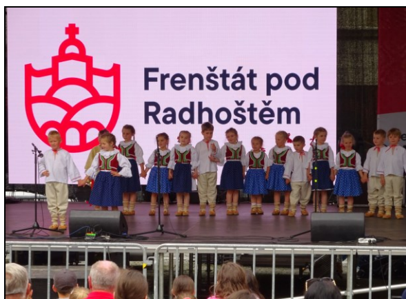
vystoupení na Dni města