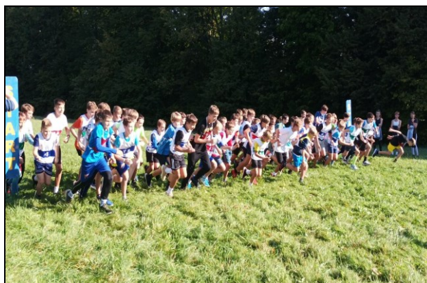
slavnostní rozloučení s žáky 9. ročníku v kině okresní finále přespolního běhu na Horečkách