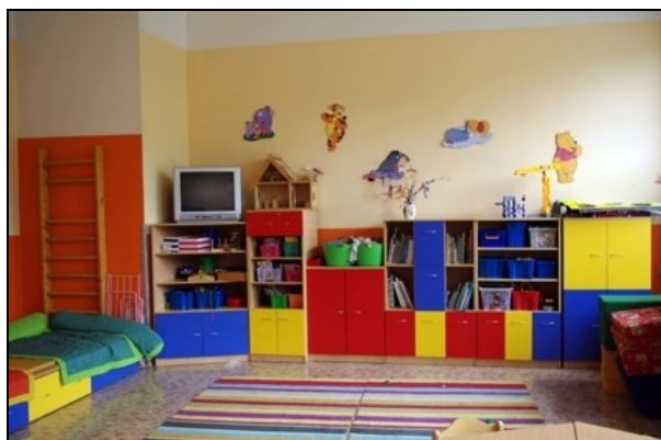
herna školní družiny