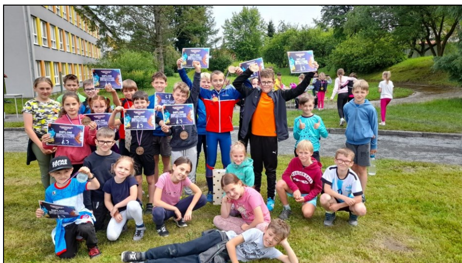
sportovní den frenštátských škol