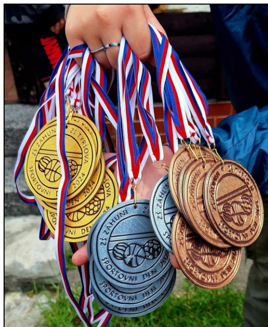
medaile z 3D tiskárny