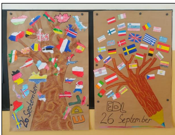
projekt Evropský den jazyků