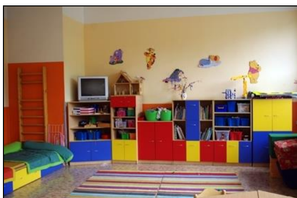
herna školní družiny