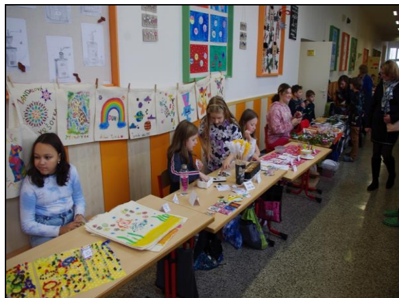
bazárek na Dni otevřených dveří