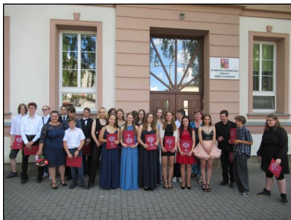
slavnostní rozloučení s žáky 9. ročníku v kině

Přispívali jsme do Frenštátského zpravodaje a do okresního tisku, spolupracovali jsme s regionální televizí TV Beskyd. Dokončili jsme realizaci projektu z výzvy OP VVV (Šablony III) a zahájili nový projekt Šablony I z OP JAK. Škola má své webové stránky, které byly pravidelně aktualizovány. Snažíme se věnovat dostatečnou pozornost prezentaci školy v místním tisku, místní televizi a nově i na facebooku. Jsme rádi, že můžeme konstatovat, že povědomí o naší škole na veřejnosti je pozitivní i přesto, že škola nemá výrazné specifické zaměření.