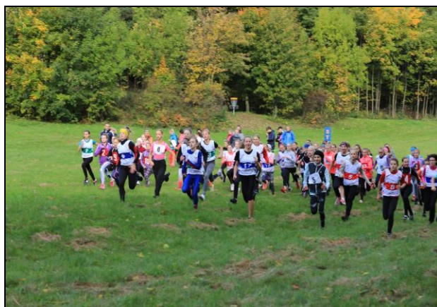
okresní finále přespolního běhu na Horečkách