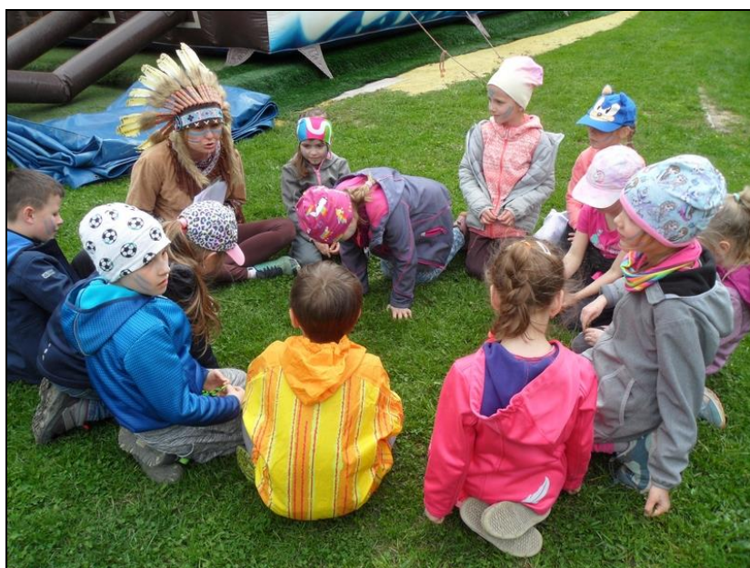
projektový den ŠD na Bílé