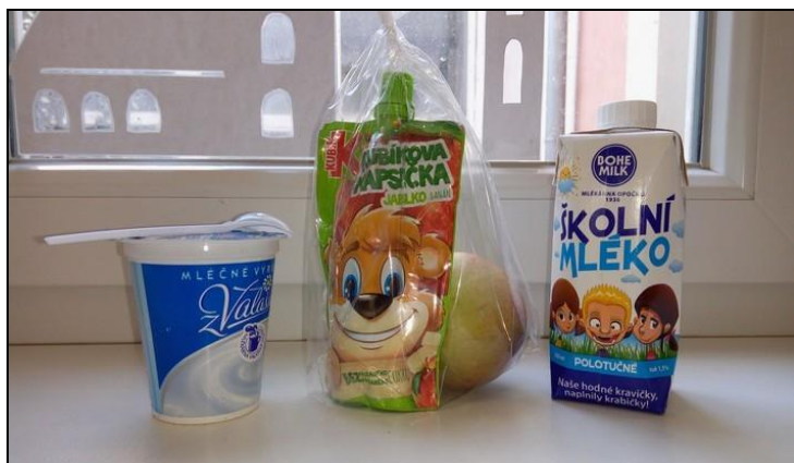
projekt Ovoce a mléko do škol (ukázka svačiny)

3) Škola je dlouhodobě zapojena také do Školního projektu Evropské unie „Ovoce a zelenina do škol“ a „Mléko do škol“, díky němuž dostávají všichni žáci 1. až 5. ročníku ve škole 1x měsíčně bezplatně ovocnou a mléčnou svačinu z nabídky Ovocentra V+V s. r. o. z Valašského Meziříčí. Tato moravská firma nám dále nabízí doprovodné programy, exkurze ve svém velkoskladu a odborné přednášky ve škole s firemním maskotem a soutěžemi. Distribuce ovocných a mléčných svačin probíhá formou čerstvých balíčků dodávaných žákům o přestávce při závozu přímo do tříd.