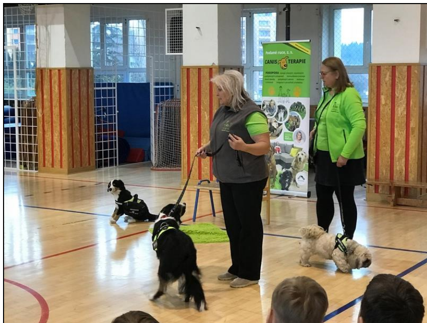
ukázka canisterapie s předáním finančního daru ze Dne otevřených dveří

K prezentaci školy přispěly rozsáhlejší akce, které se škole podařilo v průběhu školního roku zorganizovat. Z těchto akcí je třeba jmenovat okresní finále přespolního běhu na Horečkách, den otevřených dveří, školní akademii, pasování prvňáčků na čtenáře, schůzky Šikovného předškoláčka, slavnostní předání vysvědčení žákům 9. ročníku v kině, dvě sběrové akce a další.