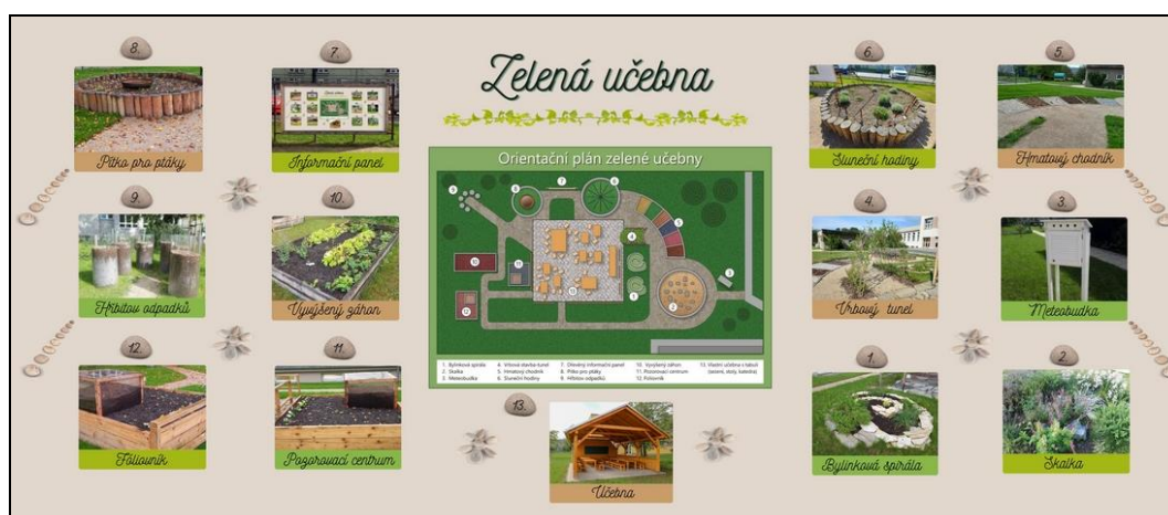
informační tabule zelené učebny

V nejbližších letech bude nutné postupně zrekonstruovat elektroinstalace ve školní kuchyni a v suterénu budovy pod velkou tělocvičnou.