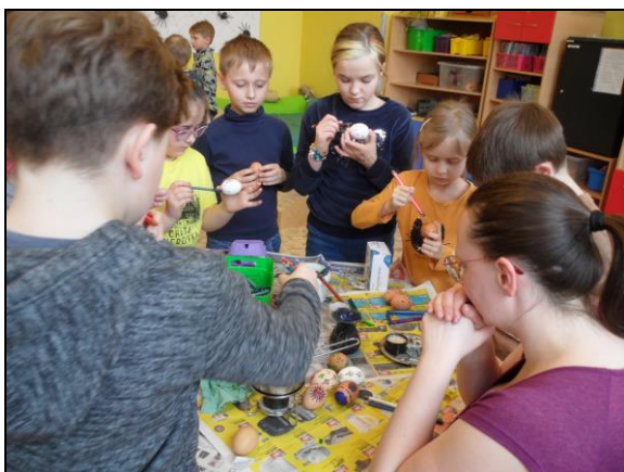
Veselé Velikonoce ve ŠD