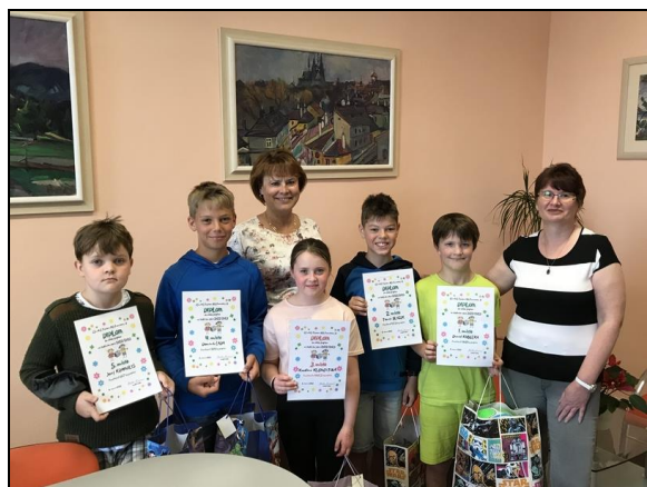
odměna vítězům sběru