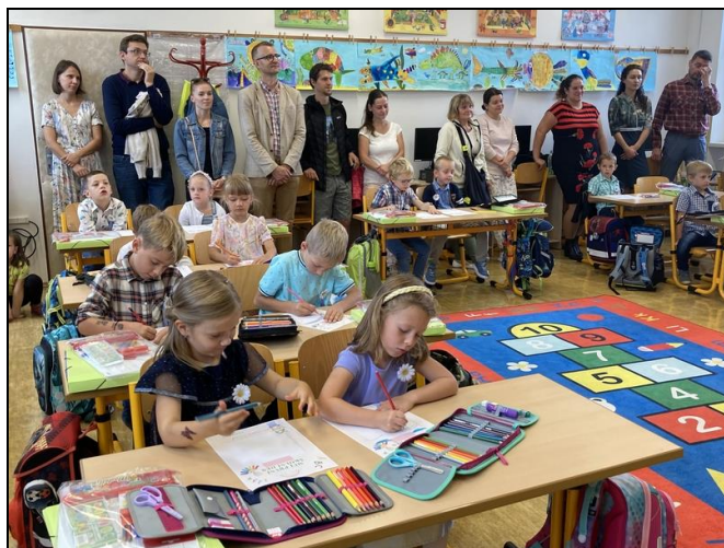
zahájení školního roku