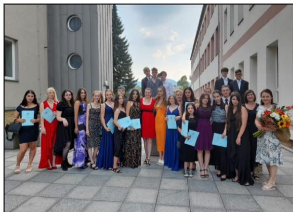
slavnostní rozloučení s žáky 9. ročníku v kině

V oblasti materiálního vybavení došlo k dalšímu významnému posunu, jak bylo již zmíněno dříve. Škola byla vybavena dalšími počítači, notebooky a digitálními učebními pomůckami, daří se jí průběžně obnovovat vybavení v jednotlivých třídách a odborných učebnách.