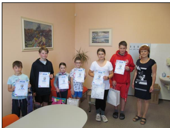
odměna vítězům sběru