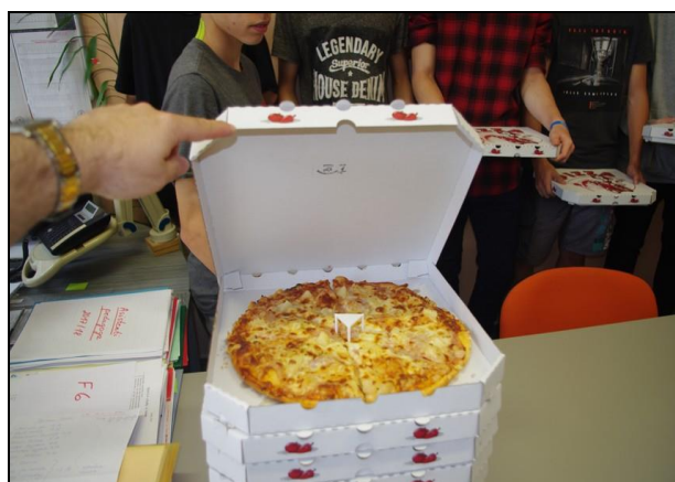
odměna pomocníkům sběru