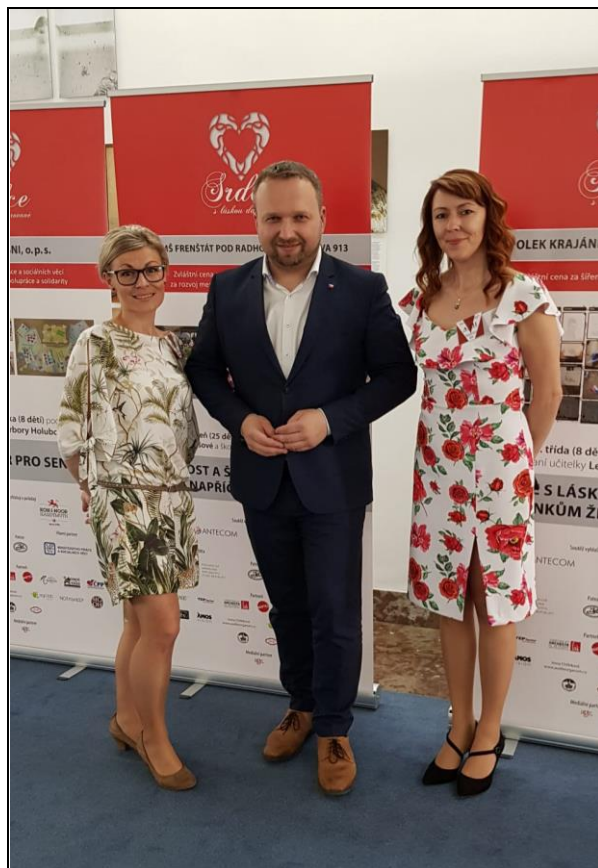
pedagogové s ministrem Marianem Jurečkou