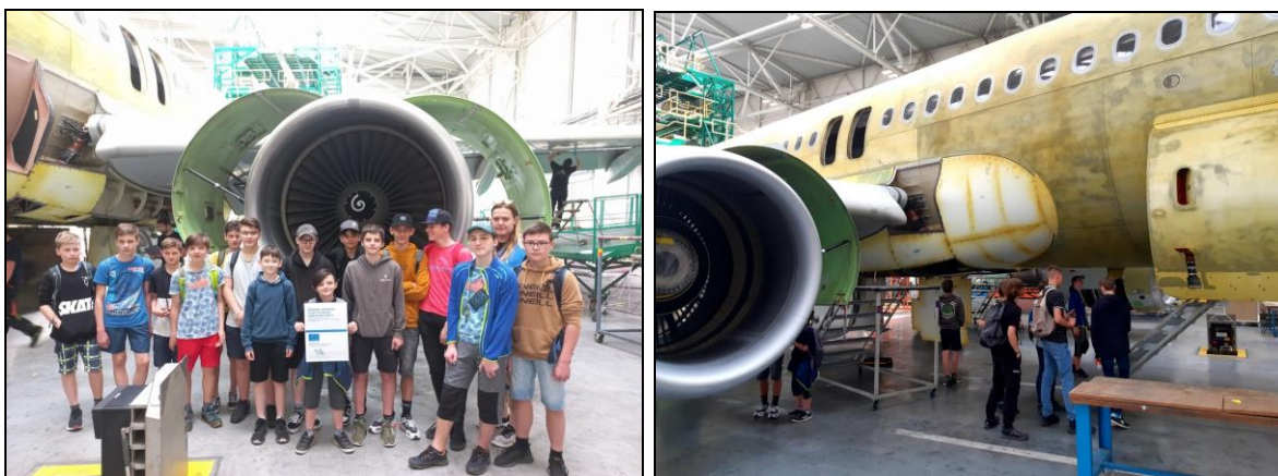
exkurze v závodě JOB AIR Technik a. s. v Mošnově