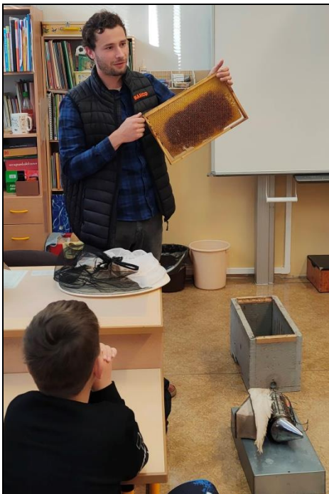
projektový den Včelaři