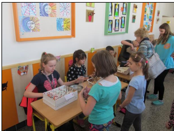
den otevřených dveří