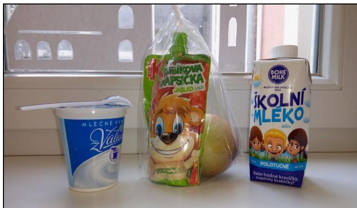
projekt Ovoce a mléko do škol (ukázka svačiny)

c) Škola je zapojena také do Školního projektu Evropské unie „Ovoce a zelenina do škol“ a „Mléko do škol“, díky němuž dostávají všichni žáci 1. až 9. ročníku ve škole 2x měsíčně bezplatně ovocnou a mléčnou svačinu z nabídky Ovocentra V+V s. r. o. z Valašského Meziříčí. Tato moravská firma nám dále nabízí doprovodné programy, exkurze ve svém velkoskladu a odborné přednášky ve škole s firemním maskotem a soutěžemi. Distribuce ovocných a mléčných svačin probíhá formou čerstvých balíčků dodávaných žákům o přestávce při závozu přímo do tříd.