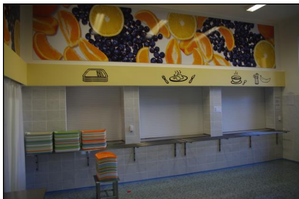
výdejní přepážka ve ŠJ