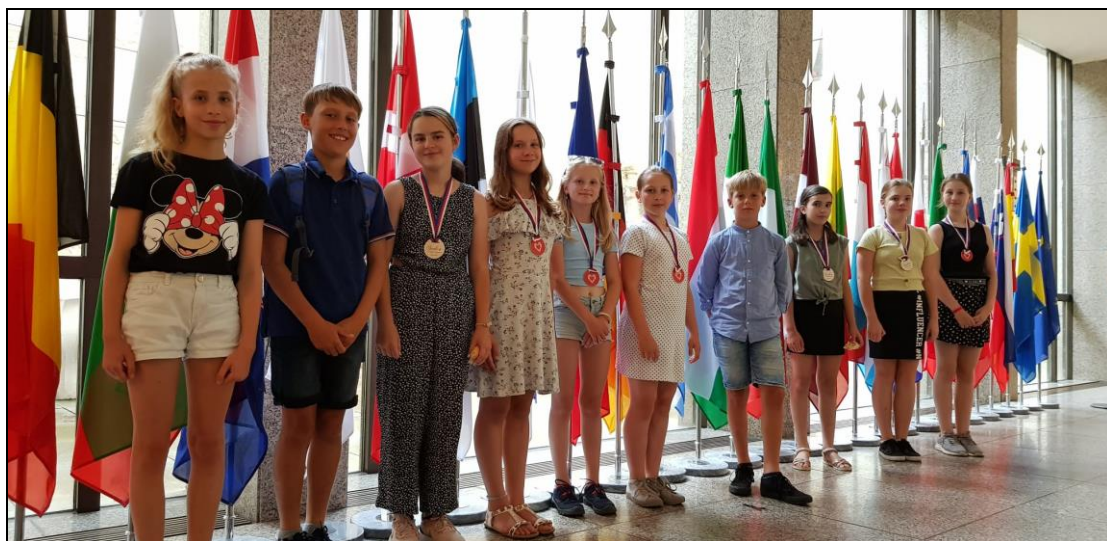
žáci v Poslanecké sněmovně po převzetí ocenění od organizátorů soutěže

Druhým rokem jsme se zapojili do 8. ročníku celostátní soutěže časopisu Age Srdce s láskou darované s projektem Radost a štěstí rozdáváme napříč generacemi , za který jsme obdrželi zvláštní cenu ministra práce a sociálních věcí Mariana Jurečky za rozvoj mezigenerační spolupráce a solidarity. Vybraní žáci byli spolu s třídní učitelkou a školní psycholožkou pozváni dne 20. 6. 2022 do Poslanecké sněmovny v Praze převzít ocenění.