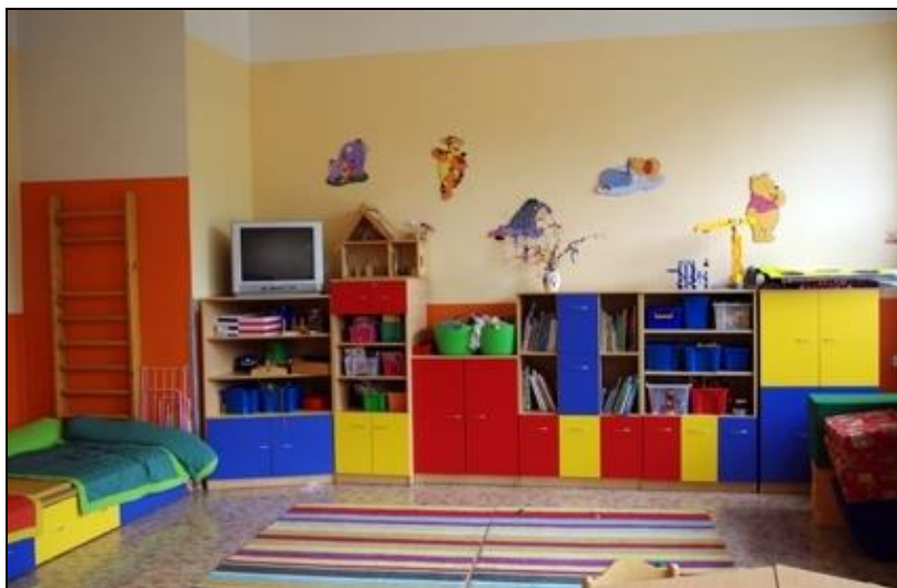
herna školní družiny