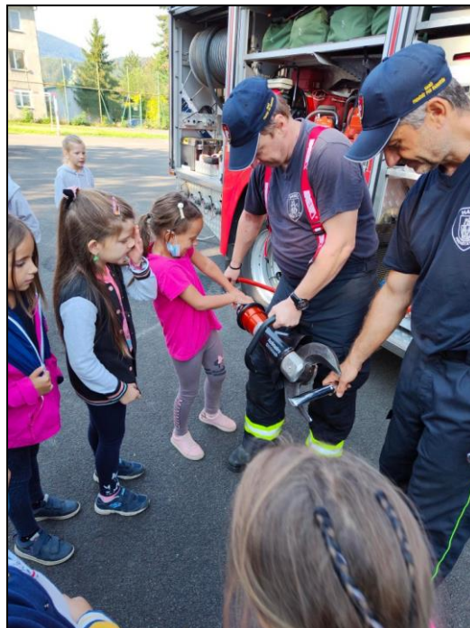
projektový den Hasiči

b) Škola se již osmým rokem zapojila do charitativního programu Obědy pro děti obecně prospěšné společnosti WOMEN FOR WOMEN, který je zaměřen na podporu sociálně slabých rodin uhrazením stravného ve školní jídelně. Do programu bylo zapojeno celkem 13 žáků, od 1. dubna 2022 nově také 19 žáků z Ukrajiny.