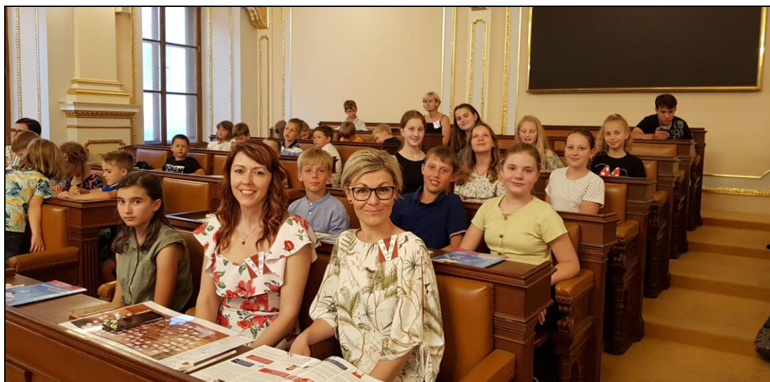
žáci s pedagogy v poslaneckých lavicích