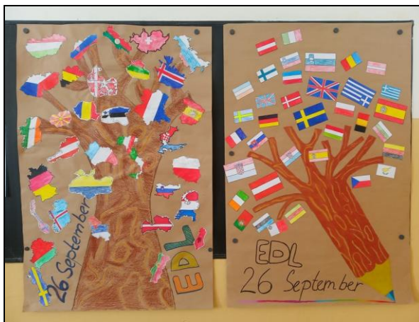
projekt Evropský den jazyků