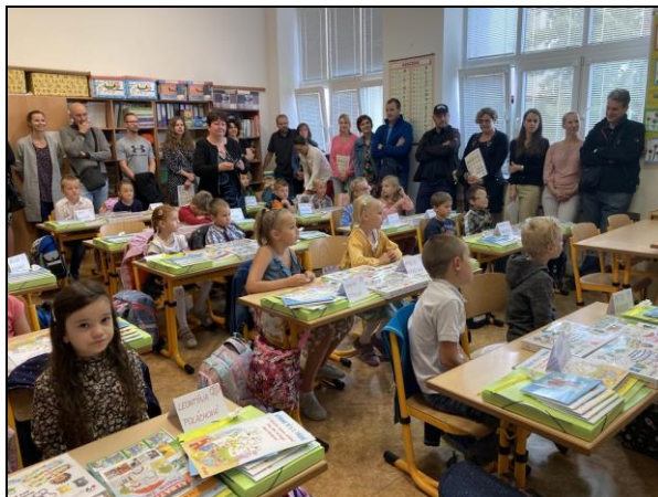
zahájení školního roku