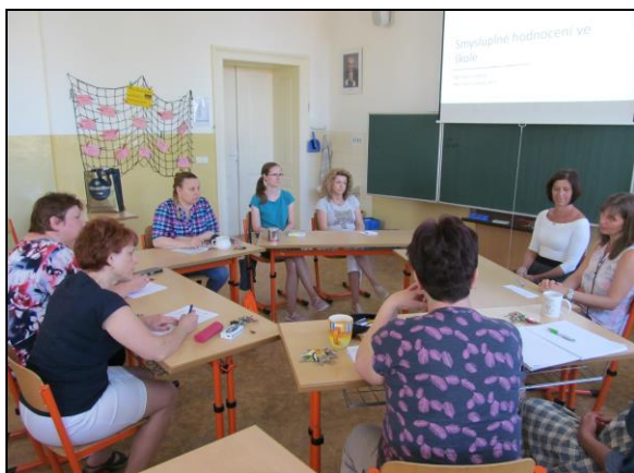
seminář pro pedagogy

e) Nově byla škola zapojena jako partner do projektu Škola4, který zajišťuje Mensa ČR v rámci projektu Moravskoslezského kraje OKAP II. Cílem projektu je zvýšení kvality didaktické práce na základních školách regionu, podpora individualizace výuky a podpora matematické gramotnosti na školách. V rámci projektu bylo zorganizováno několik seminářů pro pedagogy, škola získala do výpůjčky 5 notebooků, dvě 3D tiskárny, roboty a další pomůcky k využití ve výuce.