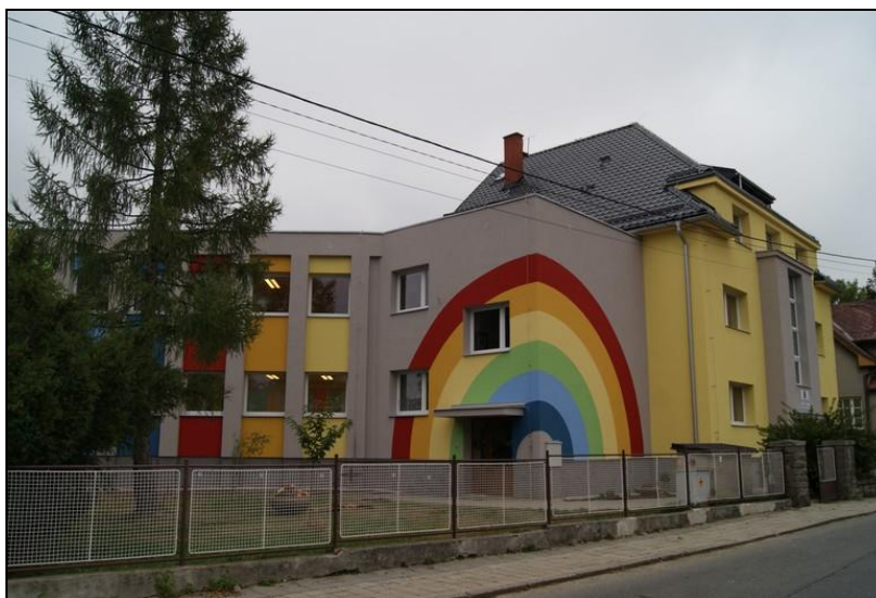
mateřská škola Markova

Přílohou této výroční zprávy je výroční zpráva mateřské školy jako součásti právního subjektu.