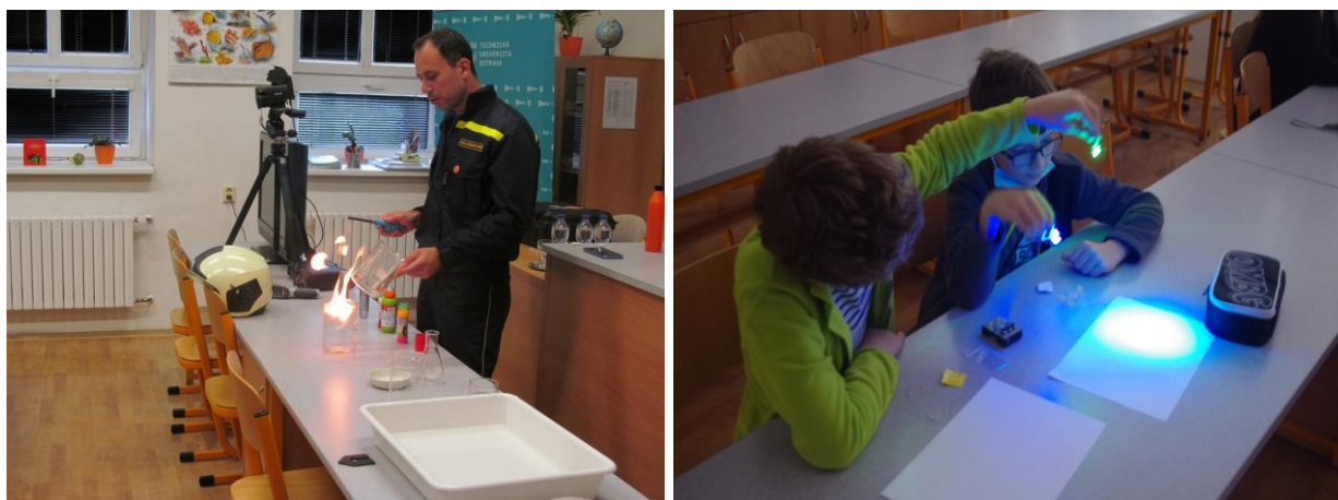
oheň a světlo – pokusy k tématům na Týdnu vědy