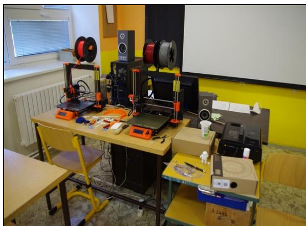
zapůjčená 3D tiskárna