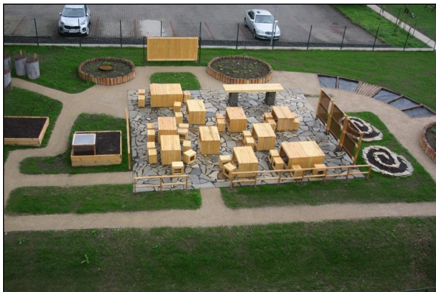
nová zelená učebna